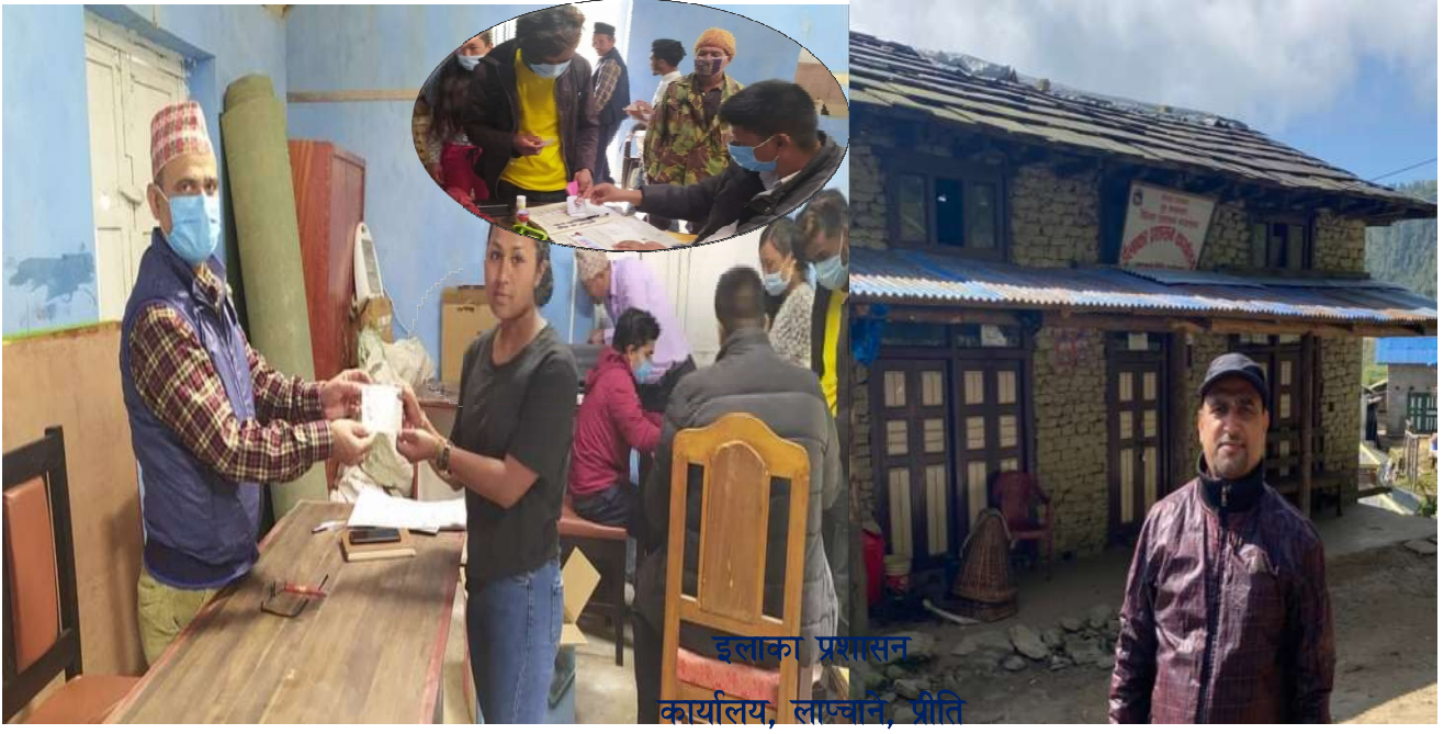
इलाका प्रशासन कार्यालय, लाप्चाने, प्रीति