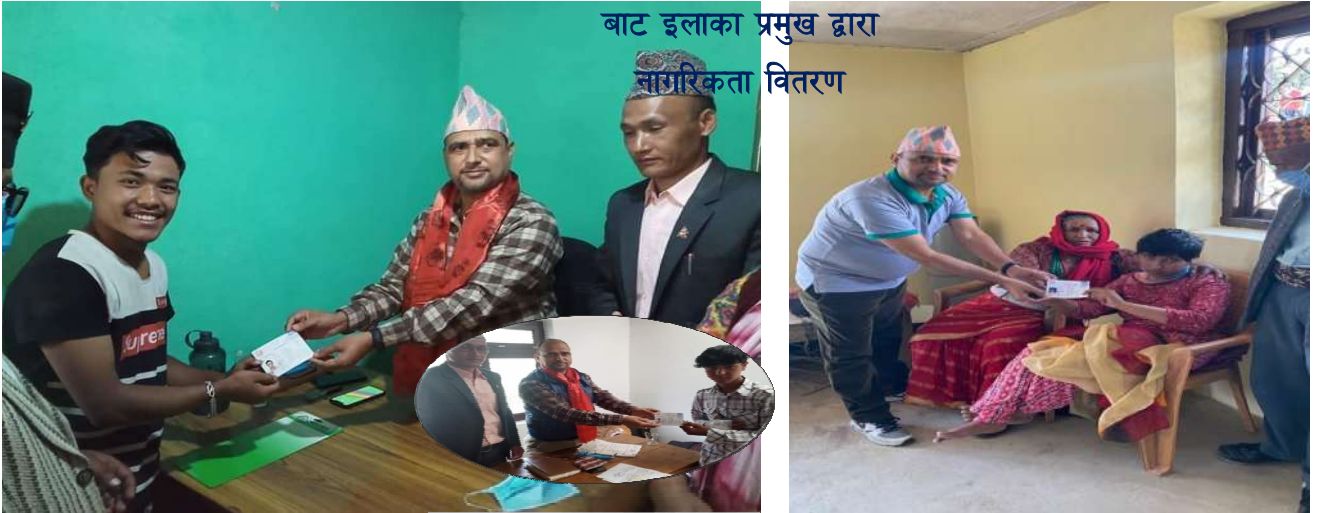
बाट इलाका प्रमुख द्वारा नागरिकता वितरण