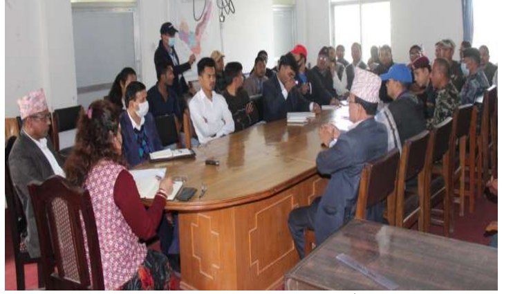
जिल्ला विपद् व्यवस्थापन समितिको बैठक

कोभिड-१९ को रोकथाम र नियन्त्रण तथा लकडाउनको पूर्णपालना गर्न गराउन अहोरात्र खटिने सुरक्षाकर्मी, स्वास्थ्यकर्मी, सबै स्थानीय तहहरू, जनप्रतिनिधि, उद्योगी, व्यवसायी, जिल्ला स्थिति कार्यालय, नागरिक समाज, सञ्चारकर्मी तथा जिल्लावासी सम्पूर्ण महानुभावहरू प्रति हार्दिक धन्यवाद व्यक्त गर्न चाहान्छौं । आगामी दिनमा यहाँहरूको थप सल्लाह सुझाव र सहयोगको अपेक्षा गर्दछौं ।