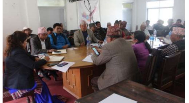
कोभिड-१९ रोकथाम, नियन्त्रण सम्बन्धि विपद् व्यवस्थापनको बैठक