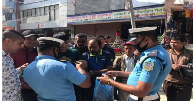
यात्रीहरुलाई माक्स वितरण गर्दै ट्राफिक प्रहरी

स्थानीय तह अन्तर्गतका वडाहरुले आफ्नो क्षेत्रभित्रका दैनिक गुजारा गरी जीवनयापन गर्ने, गरिव, असहाय व्यक्तिहरुलाई राहत विवरण गर्नको लागि तथ्याङ्क संकलन गर्ने कार्य भई रहेको हुँदा त्यस्ता अवस्थाका व्यक्ति तथा परिवारले सम्बन्धित वडामा सम्पर्क राख्न हुन हार्दिक अनुरोध छ ।