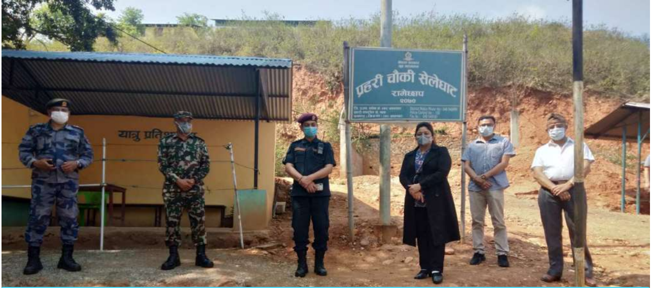
जिल्लाको मुख्य नाका मानिने रामेछाप र सिन्धुली जिल्लाको सिमा क्षेत्र रहेको सेलेघाट प्रहरी चौकीको अनुगमन तथा निरीक्षण गर्दै सबै सुरक्षा पदाधिकारीहरू