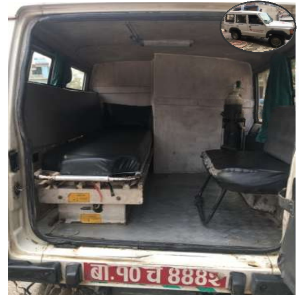
तयारी अवस्थामा रहेको COVID-19 Friendly Ambulance

जिल्ला अस्पताल रामेछाप र नेपाल रेडक्रस सोसाइटी जिल्ला शाखा रामेछापको एम्बुलेन्सलाई कोभिड-१९ मैत्री बनाई DCCMC मातहत राखिएको छ ।