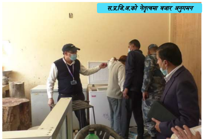
स.प्र.जि.अ.को नेतृत्वमा बजार अनुगमन