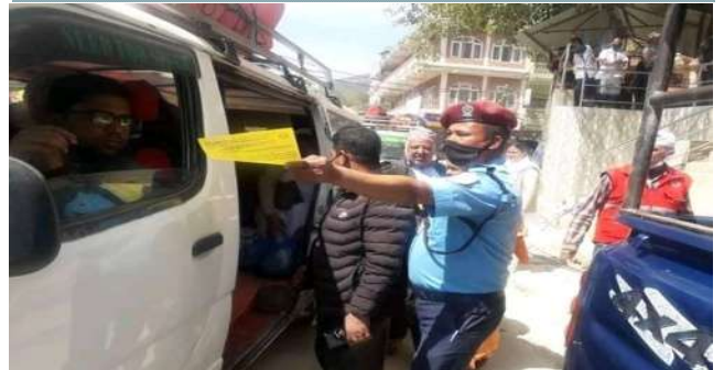
कोभिड-१९ सम्बन्धि सचेतना पर्चा वितरण गर्दै प्रहरी

जिल्ला प्रहरी कार्यालयबाट विभिन्न स्थानबाट चेतनामूलक पर्चा पम्पलेट लगायत यात्रुहरुलाई निशुल्क माक्स वितरण गरिएको छ । जिल्ला प्रशासन कार्यालय लगायत सबै स्थानीय तहहरुमा सेवाग्राहीहरुको लागि कोभिड-१९ सम्बन्धि अडियो नोटिसको व्यवस्था भएको साथै जिल्ला स्थित सरकारी तथा गैरसरकारी कार्यालयहरुमा सेवाग्राही तथा कर्मचारीहरुका लागि सेवा लिनु पूर्व अनिवार्य साबुन पानीले हाल धुने व्यवस्था गरिएको । साथै चेतनामूलक सूचना साथै जनकारीमुलक सन्देशहरु स्थानीय सञ्चार माध्यम तथा पत्रपत्रिकाहरु प्रकाश तथा प्रकाशन गरिएको छ ।