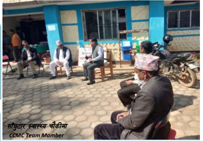
सौधुटार स्वास्थ्य चौकीमा CCMC Team Member