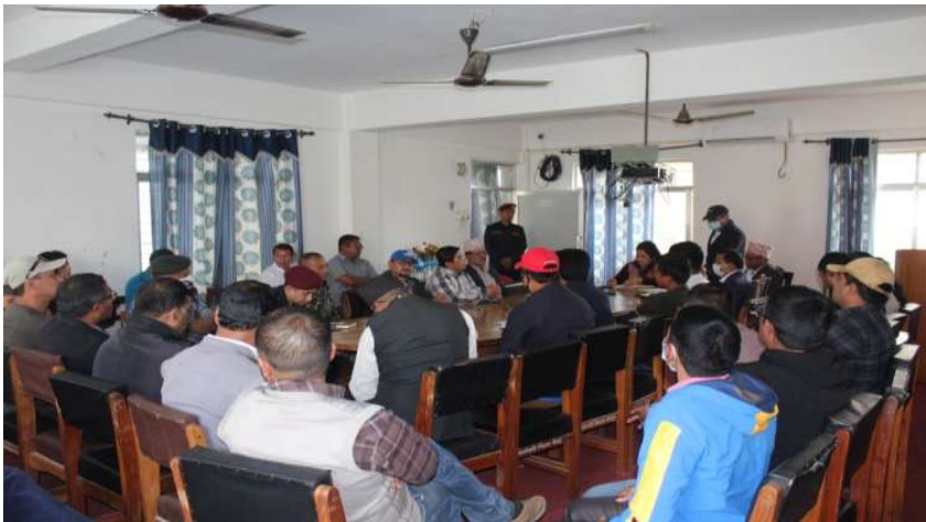
कोभिड-१९ को रोकथाम, नियन्त्रण र समन्वय सम्बन्धि जनप्रतिनिधि एवं सरोकारवालाहरूसँग भएको छलफल बैठक

रामेछाप जिल्लाबाट संघीय तथा प्रदेश सभामा प्रतिनिधित्व गर्ने सांसदज्यूहरू, नगरपालिका/गाउँपालिकाका प्रमुख/अध्यक्ष लगायतका जनप्रतिनिधिहरूको उपस्थितिमा जिल्ला विपद् व्यवस्थापन समितिको बैठक बसी कोभिड-१९ को रोकथाम, नियन्त्रण र प्रतिकार्यका लागि हालसम्म भएको कामको समीक्षा गर्दै अवलम्बन गर्नु पर्ने रणनीतिका बारेमा छलफल गरिएको छ । साथै जिल्ला स्तरमा सक्रिय राजनीतिक दलहरूको समेत उपस्थितिमा सर्वपक्षिय बैठक बसी आवश्यक निर्णय गरिएको छ ।