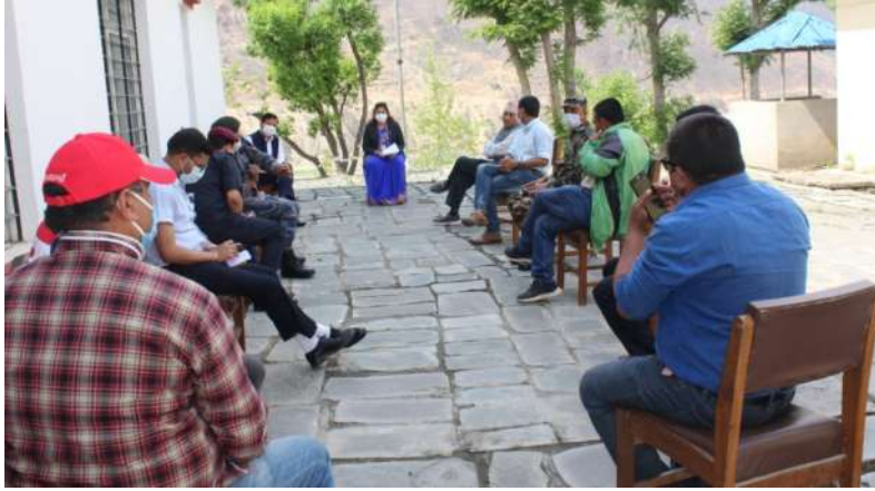
DCCMC को बैठक