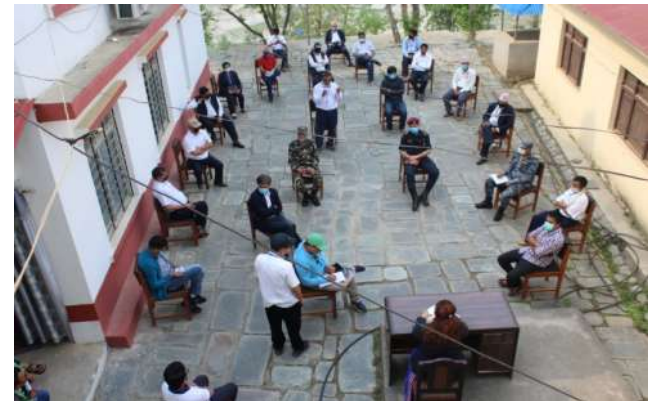
कोभिड-१९ सम्बन्धि कार्यालय प्रमुखहरूसँग छलफल