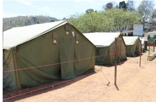
नयाँ गोरख गण, रामेछापले तयार गरेको क्वारेन्टाइन स्थल