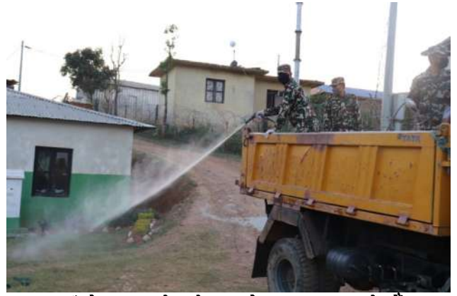
नयाँ गोरख गण, रामेछापले बजार क्षेत्रमा Disinfection स्प्रे गर्दै