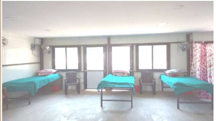
रामेछाप सामुदायिक भवनमा तयार गरिएको क्वारेन्टाइन वेडहरू

कोभिड-१९ को रोकथाम, नियन्त्रण तथा उपचारको लागि ५८ वटा आइसोलेसन वेड र २९१ वटा क्वारेन्टाइन तयारी अवस्थामा राखिएको छ ।