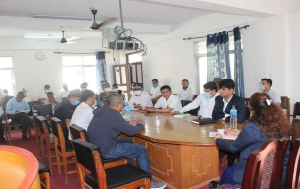
(भाद्र १६, २०७७)