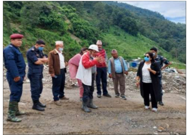
लिखु-ए ड्याम साइट

रामेछाप जिल्लाको दुर्गम ठाउँमा अवस्थित उमाकुण्ड गाउँपालिकामा प्रमुख जिल्ला अधिकारीको नेतृत्वमा DCCMC, राजनीतिक दल तथा पत्रकारहरू सहितकाका टोलिहरूले मिति २०७७/०५/२७, २८ र २९ गते अनुगमन गरिएको छ उक्त टोलिले पालिकाको विभिन्न स्थानमा भएको आइसोलेसन तथा क्वारेन्टाईनको अनुगमन गरिएको छ । टोलिले पालिकामा स्वास्थ्यका मापदण्ड, कोभिड-१९ सँग सम्बन्धित विषयमा वडा अध्यक्ष, पालिकाका कर्मचारी, स्वास्थ्यकर्मी तथा स्थानीय बासी सँग अन्तक्रिया गरिएको थियो । उक्त पालिकामा रहेका लिखु-ए, लिखु-१ र लिखु-२ आयोजनाको अनुगमन गरी आयोजनाहरूमा कामदारको अवस्था, स्वास्थ्य मापदण्ड पालना भए नभएको र आयोजनाका कामदारको लागि बनाईएको आईसोलेसन तथा क्वारेन्टाईनको निरीक्षण गरी, स्वास्थ्य सुरक्षाका मापदण्ड पालना गर्न/गराउन आयोजना संचालनमा आएका विवादको स्थानीय तहसँग समन्वय गरी समाधान गर्न निर्देशन भएको छ ।