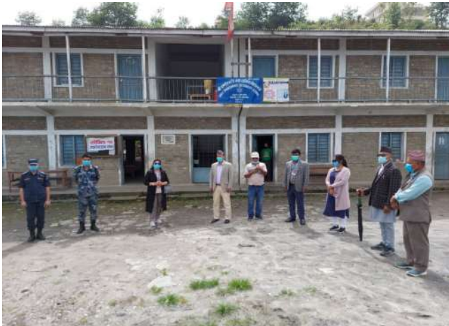
उमाकुण्ड, प्रितिमा रहेको क्वारेन्टिन