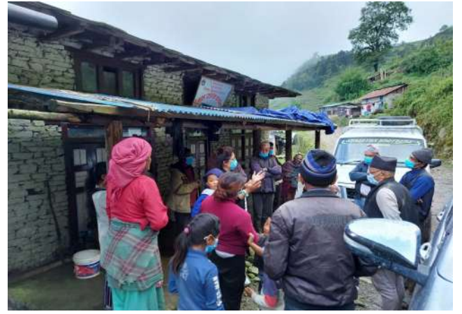
इलाका प्रशासन कार्यालय, लाप्चाने