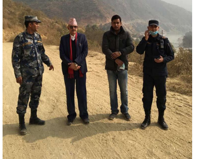
पुष्पलाल (मध्यपहाडी) राजमार्ग सडक अनुगमन

रामेछाप खण्डमा पर्ने पुष्पलाल (मध्यपहाडी) राजमार्ग सडक सम्बन्धमा जनगुनासो पश्चात प्र.जि.अ. सहित जिल्ला सुरक्षा समितिका पदाधिकारीले अनुगमन निरीक्षण गरी स्थानीय व्यक्तिहरूसँग बुझदा देखिएका समस्याहरु अविलम्ब समाधान गर्न र समयमा नै सडक निर्माण कार्य सम्पन्न गर्न सम्बन्धित निकायमा अनुरोध गरी पठाईएको छ ।