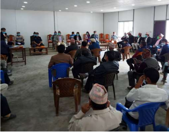
उमाकुण्ड गाउँपालिकामा कार्यक्रम