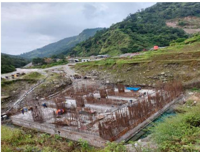
लिखु-२, पावर हाउस