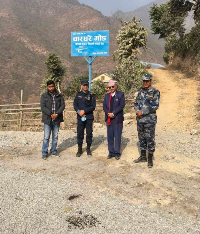
सित्खा-गोलगनपानी कालो पत्रे सडक अनुगमन

सित्खा-गोलगनपानी सडकको कालोपत्रे भएको अधिकांश भागको तेस्रो पक्ष (स्वतन्त्र) प्राविधिक टोली खटाई अध्ययन गराई सत्य तथ्य पत्ता लगाउन र कमजोरी देखिए जिम्मेवार व्यक्ति तथा निकायलाई नियमानुसार कारवाही गरी गुणस्तरीय कार्य गराउन पहल गरी जनगुनासो व्यवस्थापनमा सहयोग गर्न सम्बन्धित निकायमा अनुरोध गरी पठाईएको छ ।