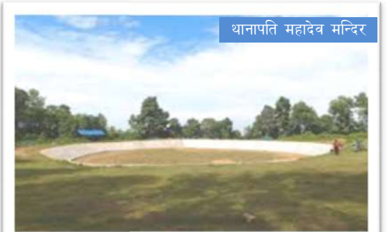
थानापति महादेव मन्दिर